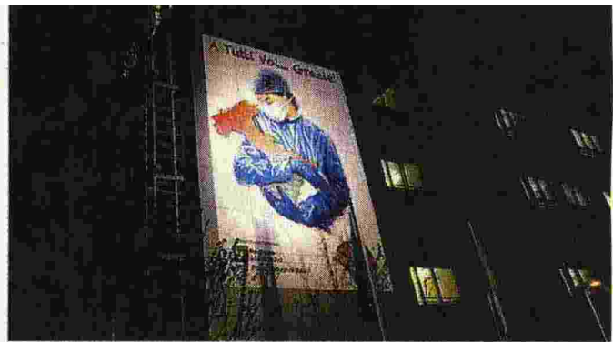
Il murale all'ospedale Papa Giovanni