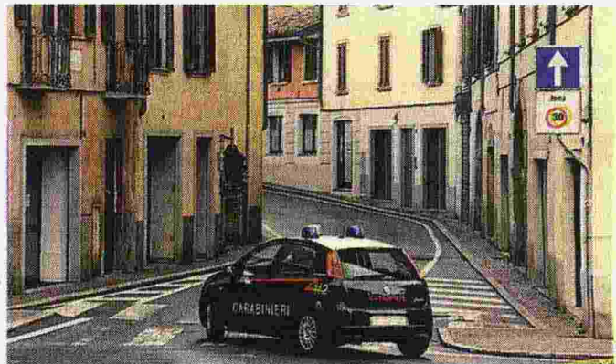
Il paese di Alzano deserto in uno scatto del marzo scorso