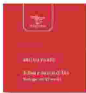
BRUNO FORTE "Eclissi e ritorno di Dio Teologie del XX secolo" Morcelliana, 10 euro

to adattamento a un nuovo ordine sociale ed economico: da questo crogiolo nacque la complessità dell'Europa moderna. Il libro ricostruisce, utilizzando alcuni passi di storici latini e greci poco conosciuti dal grande pubblico e tradotti per l'occasione, le vicende di uno dei momenti più affascinanti della storia universale. Attraverso le biografie di Giustiniano, di Teodora e del generale Belisario, il lettore è condotto in un viaggio tra guerre sanguinose, intrighi di corte, straordinarie opere architettoniche come la basilica di Santa Sofia e la scrittura di Codici di legge destinati all'eternità. Il libro non è soltanto la biografia di un imperatore, ma una guida per comprendere come, tra crolli e rinascite, si siano poste le fondamenta della nostra civiltà.