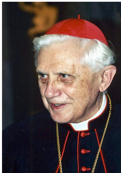
Il cardinale Joseph Ratzinger in una foto del 2001

In questo quadro postsecolare della società occidentale la religione è portatrice di valore sia per il bagaglio concettuale elaborato nei secoli dalla teologia, sia per le risorse morali, a patto che rinunci "al dogmatismo e alla coercizione sulle coscienze". La religione rappresenta allora la possibilità di "percepire ed esprimere, in maniera altamente differenziata la vita deviata, le patologie sociali e la deformazione di contesti degradati" (p.35), ciò che non trova altrove spazio. Alla filosofia spetta il compito di apprendere questi contenuti di senso e tradurli, nel senso di portarli nel contesto sociale di secolarizzazione al fine dell'apprendimento e del dialogo pubblico. Per questo Habermas parla di secolarizzazione non distruttiva.