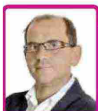
risponde Alberto Pellai medico, psicoterapeuta, 4 figli