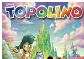
Topolino 3673 porta i lettori nel Meraviglioso Mondo di Oz