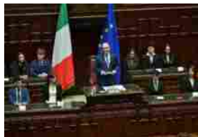
"Montecitorio - Un secolo d'arte", proiezione in anteprima con Fontana