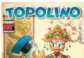
Topolino celebra Puccini: su "Topolino 3674"