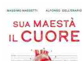
Libri: "Sua maestà il cuore", presentazione a Montecitorio