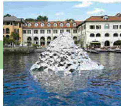
MICHELE DALLA PALMA