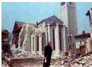
David Maria Turoldo