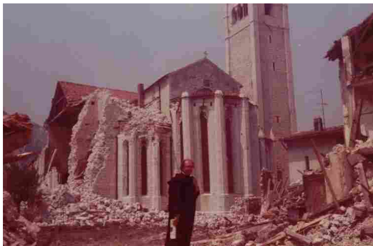
Archivio del Priorato di Sant'Egidio.

Nel cinquantesimo anniversario del sisma del 1976, la diocesi di Udine promuove convegni, una mostra e una celebrazione a Gemona con il card. Zuppi. Un volume raccoglie gli scritti di padre Turoldo, voce intensa della tragedia e della ricostruzione del popolo friulano