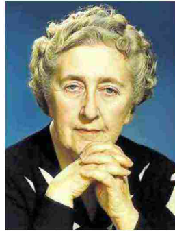
La scrittrice Agatha Christie (1890-1976) in una foto colorizzata del 1958

Ritaglio stampa ad uso esclusivo del destinatario, non riproducibile.